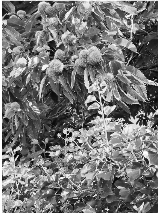
kastanjes aan de boom

Het lijkt erop dat de zomer voorbij is. De eerste tekenen van de naderende herfst zijn zichtbaar. Maar dat hoeft ons er niet van te weerhouden de deur uit te gaan. Onze agenda staat vol activiteiten en u bent van harte welkom.