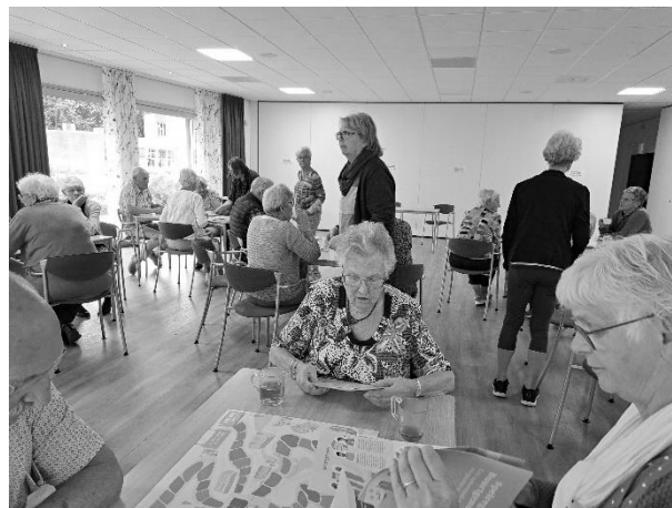
Wat ligt er op tafel????

Draag een fietshelm, beter een platgedrukt kapsel dan ernstig hersenletsel door een (onge)val.